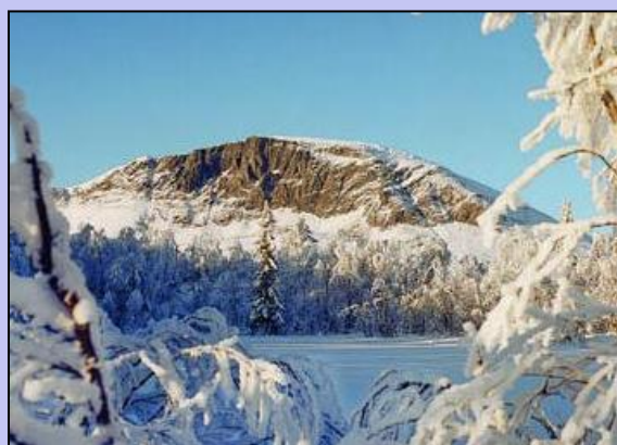
Hemsedalsrennet går i flotte omgivelser.

Start: Kl. 11 på turrennet. Disanserennet har klassevis fellesstart fra kl. 11:05. De yngste starter først.